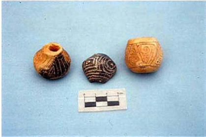
Foto 7. Piruros decorados

Hubo gran variedad de piruros en cuanto a formas, tamaño y decoración: incisos, pintados y no decorados (ver fotos 7 y 8).