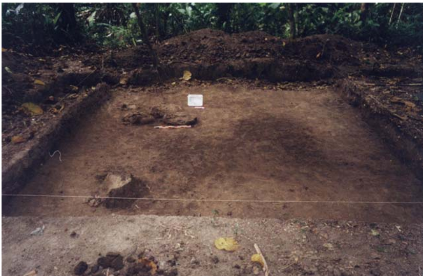
Foto 1. Vista del Área 01

El Área 01 presentó una forma cuadrangular y sus dimensiones fueron de 5x5 m., orientándose en dirección Norte (ver foto 1). La superficie se encontraba cubierta de vegetación de aproximadamente 30 cm. de alto, la que fue retirada para iniciar las excavaciones.