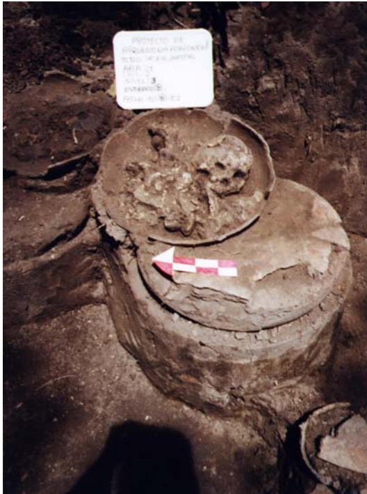
Foto 4. Contextos de Distribución Vertical