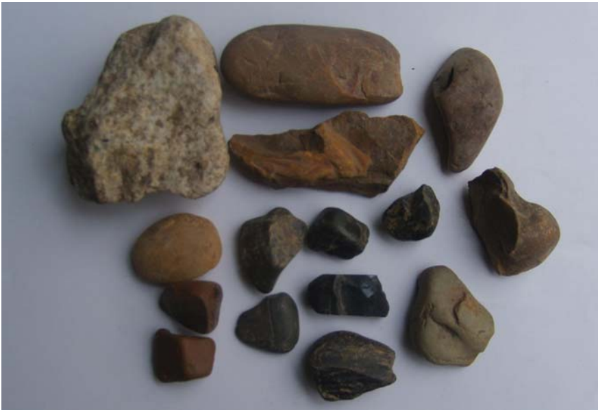
Foto 9. Material lítico recuperado cerca de algunos entierros