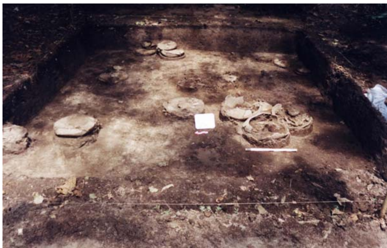
Foto 2. Vista del Área 01 y los contextos funerarios

Los Entierros, Hallazgos y fragmentería de cerámica se encontraron distribuidos en toda el área excavada (ver foto 2).