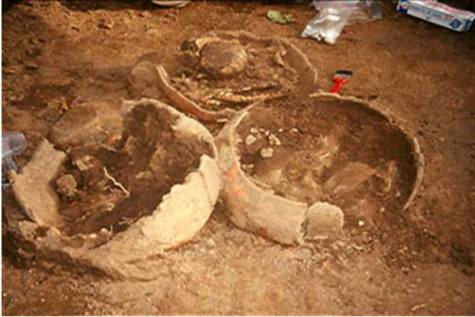
Foto 3. Contextos de Distribución Horizontal